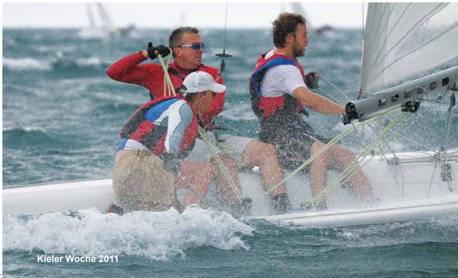
Kieler Woche 2011